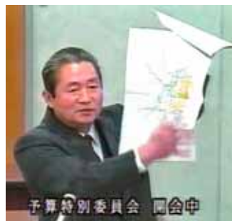
下水道計画の見直しを

国民健康保険税のさらなる引き下げ 介護保険、障害者福祉の施設、サービスの拡充 市営バスの運行改善を県内でも高い水道料金は、さらに値下げを