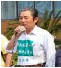
「核兵器のない世界を」、 平和行進で訴える

主要な農作物の価格安定対策と農産物の販路拡大を 農産物の輸入自由化にストップ 生ごみの堆肥化と農地に有機肥料推奨を