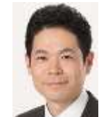
参議院議員 たけだ良介