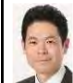
参議院議員 たけだ良介