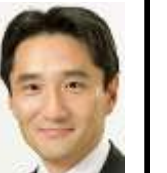
衆議院議員 藤野保史