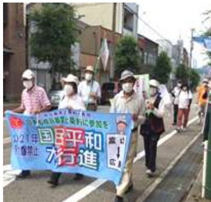
石動駅前商店街を歩く 平和行進参加者=6月11日

平和行進は6月11日、市役所前での集会の後、2時過ぎに出発し、石動駅前まで沿道の皆さんに「核兵器の廃絶」「日本政府も禁止条約に参加を」とアピールしました。今年にはコロナ禍で感染防止のため、街頭署名を止め、スタンディング・アピールに取り組みました。