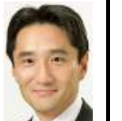
衆議院議員 藤野保史