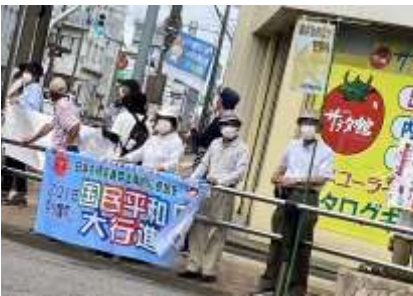
石動駅前スタンディング・アピール