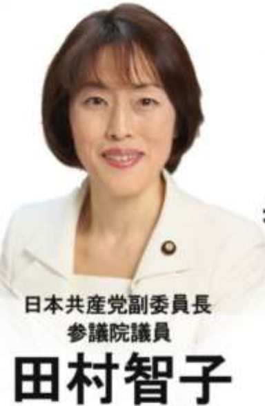
日本共産党副委員長 参議院議員 田村智子