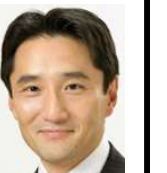
衆議院議員 藤野保史