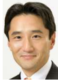
衆議院議員 藤野保史