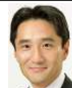
衆議院議員 藤野保史