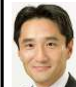
衆議院議員 藤野保史