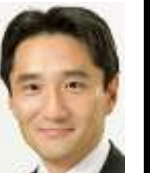
衆議院議員 藤野保史