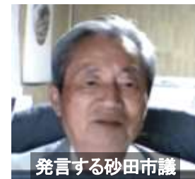
発言する砂田市議

小矢部市は市独自で、ひとり親家庭に臨時給付金を1世帯10万円支給します。高岡市も市独自に、ひとり親家庭に1世帯3万円を支給します。