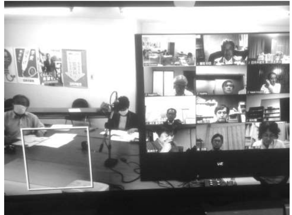
オンライン会議の画面。背景は日本共産党富山県委員会事務所 右枠内は会議参加者＝5月27日

日本共産党富山県委員会が全県コロナ対策オンライン会議を5月27日に開き、県民の暮らしや営業の状況などについて実情を把握し、これまでのそれぞれの自治体での取り組みを交流しました。オンライン会議はインターネット上でZOOMを使って県委員会事務所と県内の日本共産党議員や市民団体などを結んで行われました。コロナ対策オンライン会議は4月28日に続いて2度目です。ここで取り上げられた内容からいくつか紹介します。