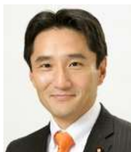
藤野保史 衆院議員