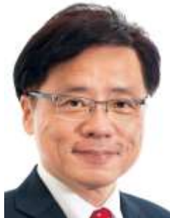
井上さとし 参院議員