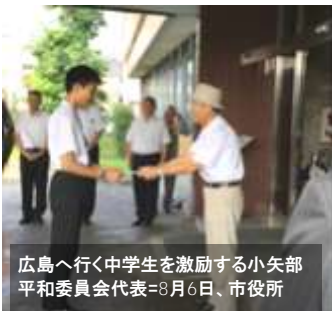
広島へ行く中学生を激励する小矢部平和委員会代表=8月6日、市役所

それぞれ代表からレポートを出してもらっているので、学校とも相談しながら検討したい。