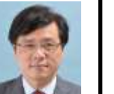
参議院議員 井上哲士