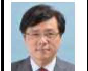
参議院議員 井上哲士