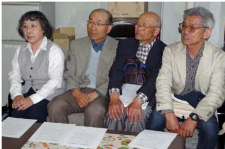
記者会見する「市民アクションおやべ」の代表の皆さん=6月10日、小矢部市役所

全国で安倍9条改憲ノ一3000万人署名運動が展開されています。記者会見で代表たちは、小矢部市でも人口比でそれに匹敵する7500名の署名をめざし、引き続き安倍9条改憲を断念させるまで運動を広げていくと、決意を述べました。