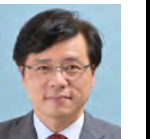
参議院議員 井上哲士